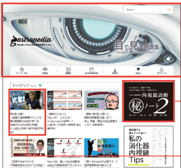
(3) トップページ：メインビジュアル・カラーセル広告